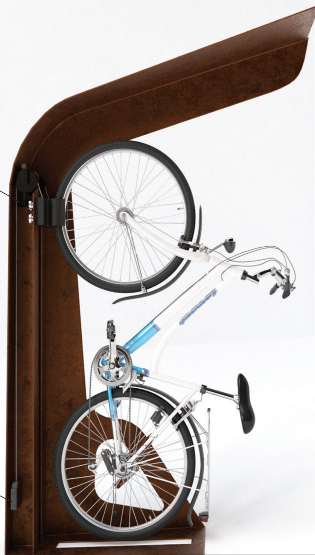
sistema de contrapeso